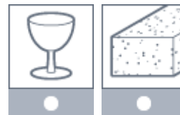
Glas und Keramik