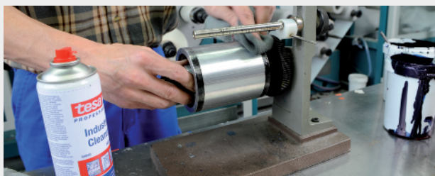
Schnelles und effizientes Reinigen