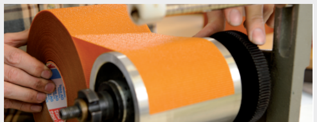
Saubere, fettfreie Oberflächen für optimale Verklebungen